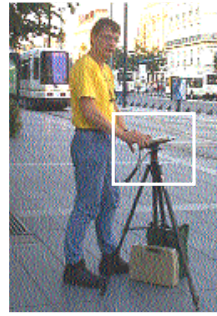
Cette partie de l'étude fut réalisée en collaboration avec l'UMR Ambiance du CNRS (CERMA Nantes)